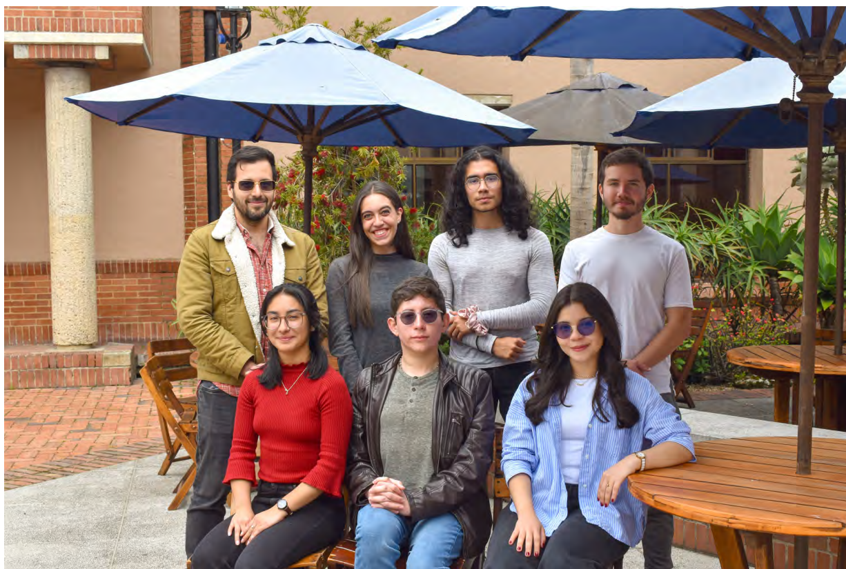
Figura 1. Comité editorial de la Revista de Estudiantes É-gora

través de la lectura, escritura y el diálogo. Puesto que la palabra ágorá se entiende en griego como asamblea y se asocia con la actividad socrática del diálogo, buscamos que la filosofía aparezca como algo abierto al público y no sólo como un privilegio reservado para unos pocos. La Revista de Estudiantes É-gora comparte nuevas ideas propuestas por estudiantes sobre diversos temas en filosofía a través de artículos académicos y reconoce como formas de hacer filosofía expresiones literarias que incluyen cuentos, poemas y fábulas.